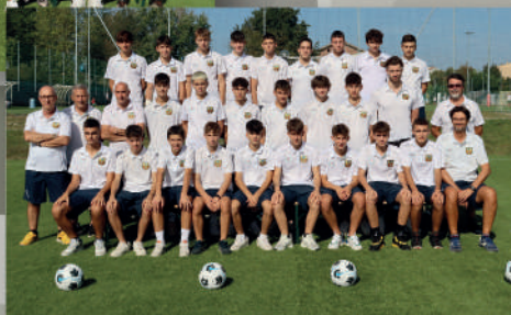
UNDER 16 ALLIEVI REGIONALI