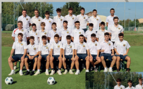
UNDER 17 ALLIEVI PROVINCIALI