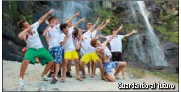
Guardando al futuro

A tutti, un arrivederci ed un in bocca al lupo per la stagione appena cominciata!