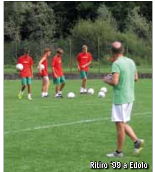
Ritiro '99 a Edolo