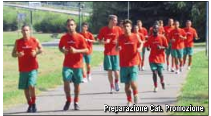
Preparazione Cat. Promozione