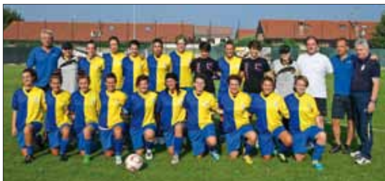
Femminile Serie D

La nuova società ci ha rimesso al centro di un importante progetto, e il nostro impegno sarà sicuramente all'altezza e faremo di tutto per ritornare ai vertici. Il tifo non è mai mancato in questi anni, anche nei momenti più complessi e confusi, e ormai riconosciamo bene i nostri affezionati supporter. Ma la strada è ancora lunga e per questo vi invitiamo a seguirci nelle prossime domeniche in casa. La nostra casa è sempre la stessa, lo stadio "Salvatore Missaglia". Donne e Sport sono portatori di speranza... "Speranza Agrate" !