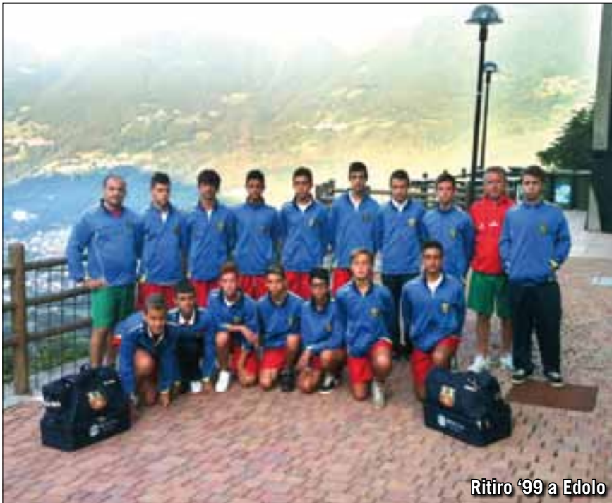
Ritiro '99 a Edolo