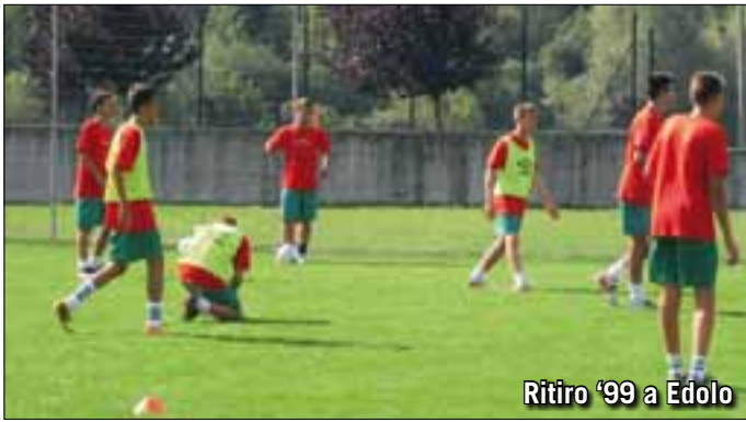
Ritiro '99 a Edolo