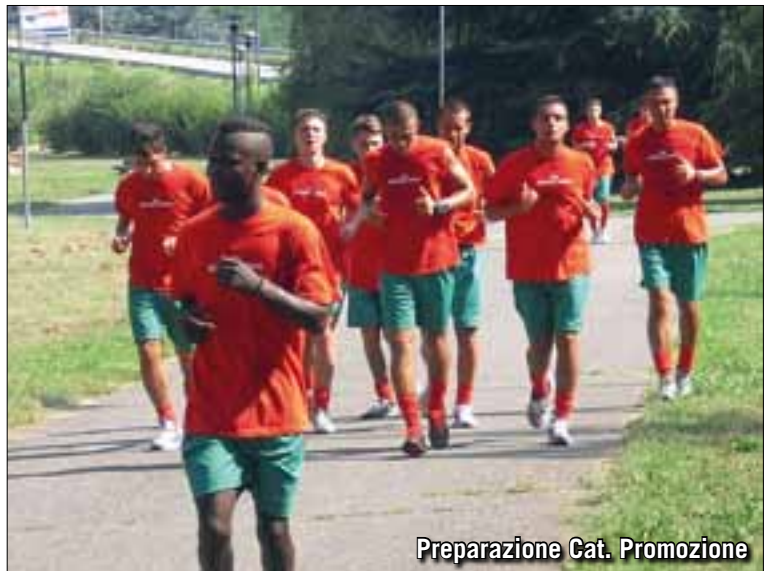
Preparazione Cat. Promozione