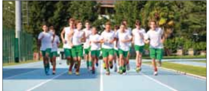
Ritiro a Chiavenna