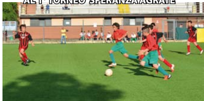
... E ANCHE GLI "ALLIEVI 98" AL VIA