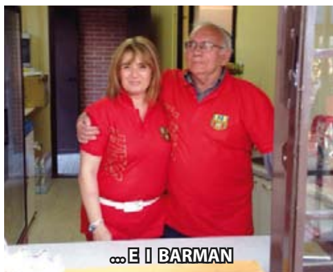
...E I BARMAN