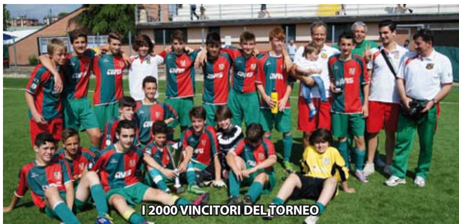
I 2000 VINCITORI DEL TORNEO