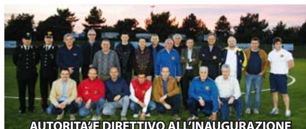
AUTORITA' E DIRETTIVO ALL' INAUGURAZIONE