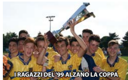
I RAGAZZI DEL '99 ALZANO LA COPPA