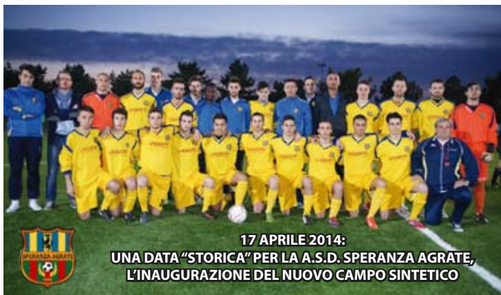
17 APRILE 2014: UNA DATA “STORICA” PER LA A.S.D. SPERANZA AGRATE, L'INAUGURAZIONE DEL NUOVO CAMPO SINTETICO