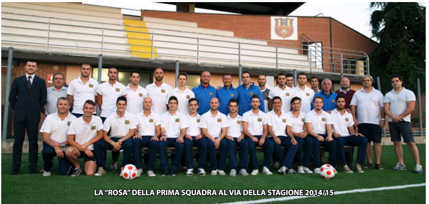
LA "ROSA" DELLA PRIMA SQUADRA AL VIA DELLA STAGIONE 2014/15

Le idee ci sono e chiare, l'organico è completo e di valore. Ora non resta che giocarsela.