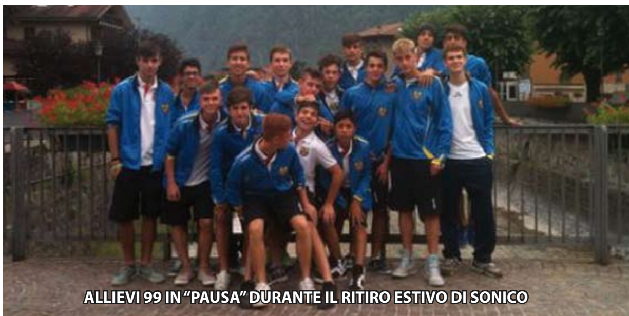
ALLIEVI 99 IN "PAUSA" DURANTE IL RITIRO ESTIVO DI SONICO