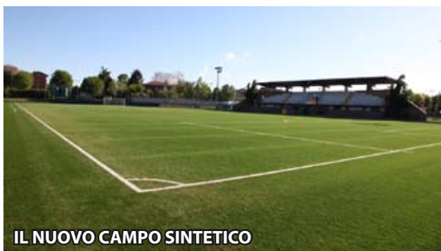
IL NUOVO CAMPO SINTETICO

PERIODICO INFORMATIVO A.S.D. SPERANZA AGRATE - DISTRIBUZIONE GRATUITA - NUMERO 4 - SETTEMBRE 2014