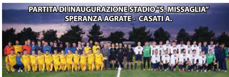
PARTITA DI INAUGURAZIONE STADIO "S. MISSAGLIA" SPERANZA AGRATE - CASATI A.