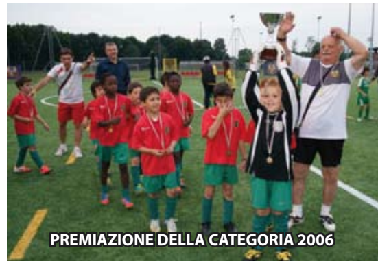
PREMIAZIONE DELLA CATEGORIA 2006

Questi i numeri di un successo reso tale da entusiasmo, agonismo, sportività, passione ed allegria, ovvero gli ingredienti fondamentali di questo evento. Un ringraziamento enorme a tutti coloro che hanno collaborato alla buona riuscita di quello che è stato il primo di una lunga, lunghissima, ci auguriamo, serie di tornei, che saremo orgogliosi di proporre nei prossimi anni con l'obiettivo di migliorarci e continuare a raccogliere persone che amano, come noi, lo sport sano. Vi aspettiamo!