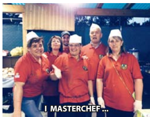
I MASTERCHEF ...