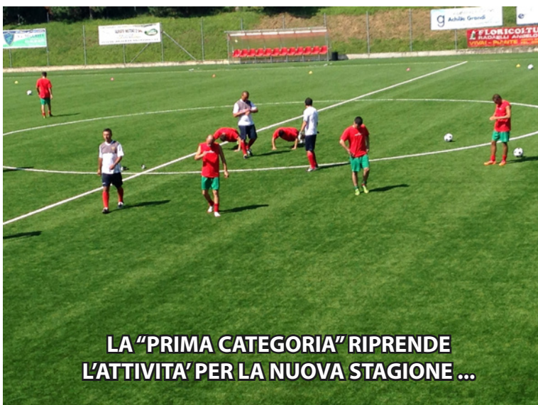
LA "PRIMA CATEGORIA" RIPRENDE L'ATTIVITA' PER LA NUOVA STAGIONE ...