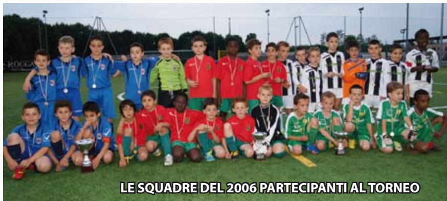
LE SQUADRE DEL 2006 PARTECIPANTI AL TORNEO