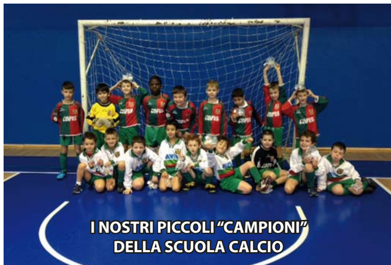
I NOSTRI PICCOLI "CAMPIONI" DELLA SCUOLA CALCIO