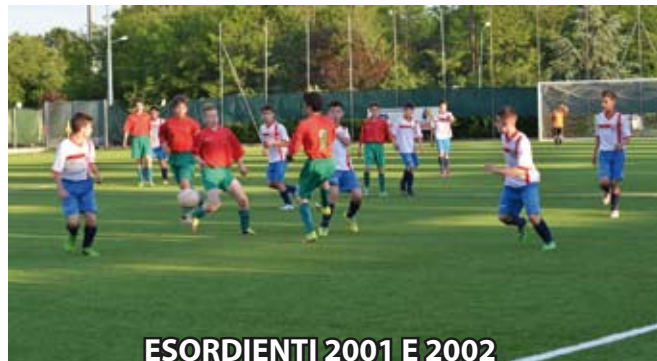
ESORDIENTI 2001 E 2002 AL 1° TORNEO SPERANZA AGRATE