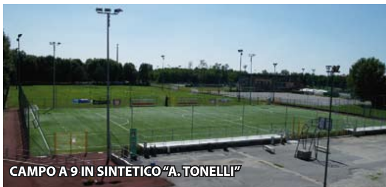
CAMPO A 9 IN SINTETICO "A. TONELLI"