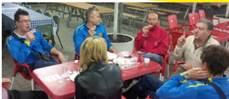
IL RIPOSO DEI GUERRIERI A FINE SERATA