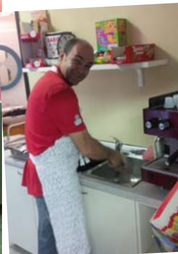
ANCHE GLI UOMINI LAVANO I PIATTI ...