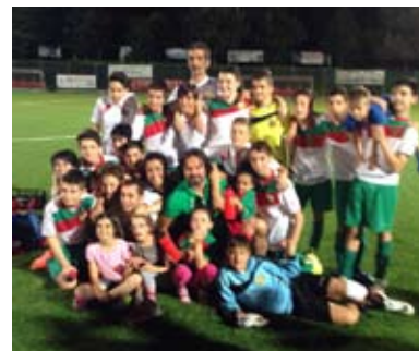
2002 .... ANCORA PRIMI!

A tutti loro un grazie infinito, sappiamo che sarà difficile fare meglio .... ma lo faremo !! Al prossimo anno