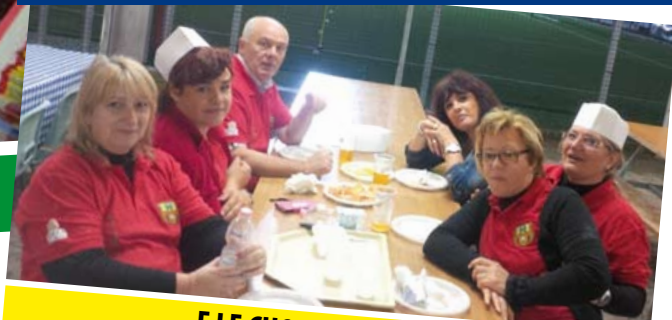
... E LE CUOCHE MANGIANO!