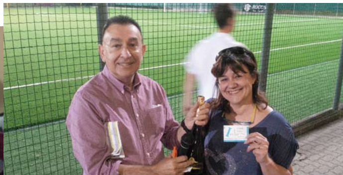
UNO DEI VINCITORI DEI PREMI ESTRATTI