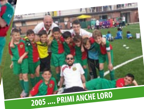
2005 .... PRIMI ANCHE LORO