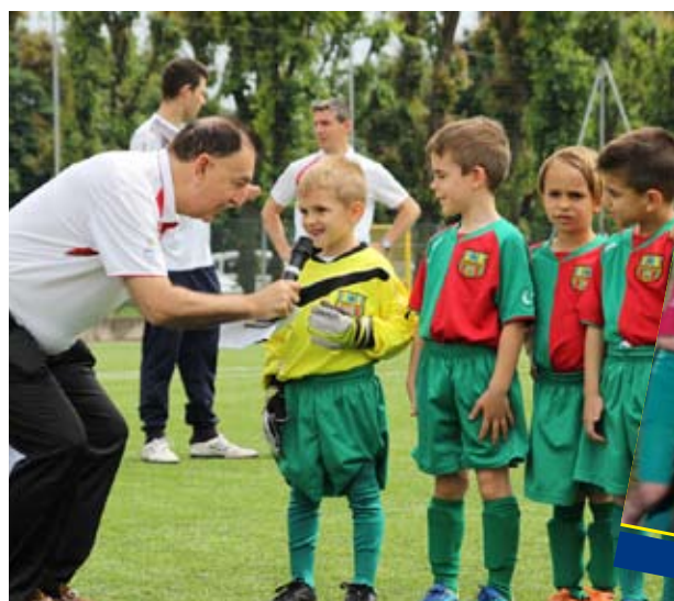
GIOVANI CAMPIONI ALLA PRIMA INTERVISTA