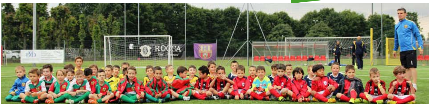
PICCOLI AMICI: TORNEO 2008/2009