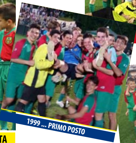
1999 ... PRIMO POSTO