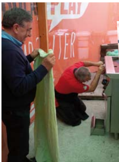
IL PRESIDENTE PRONTO A SPEGNERE IL FUOCO