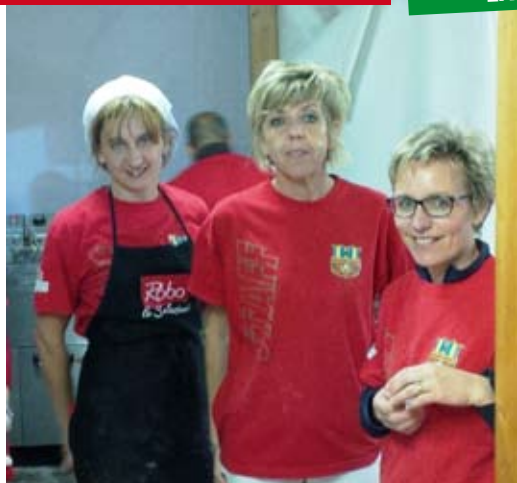
LE MATRICOLE IN CUCINA