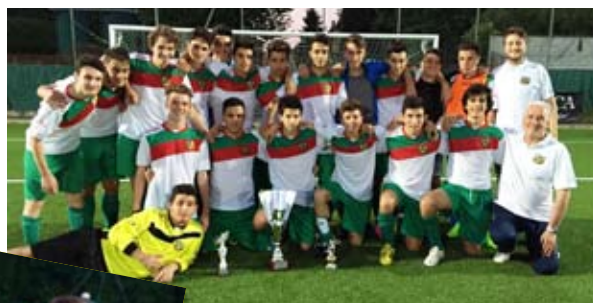
1998 .... PRIMO POSTO