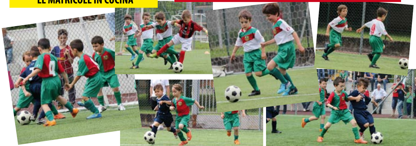
PICCOLI AMICI IN AZIONE ... SPETTACOLO ALLO STATO PURO!