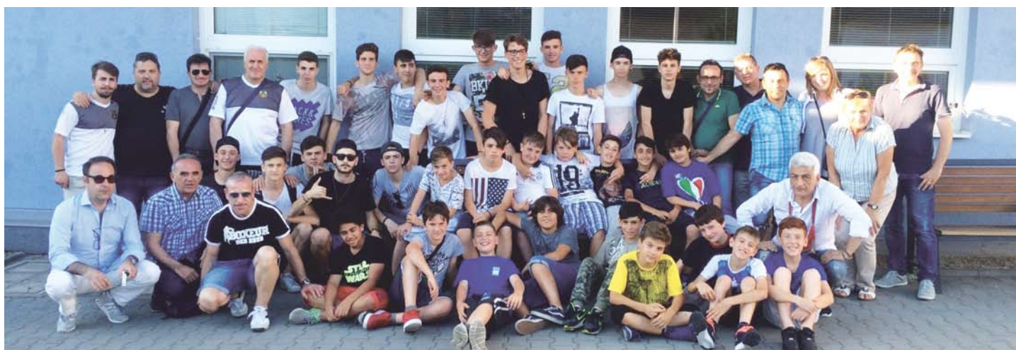
LA DELEGAZIONE SPORTIVA IN TRASFERTA A CESKA TREBOVA