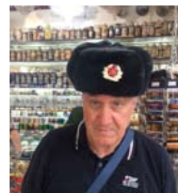
IL NOSTRO MITICO DIRIGENTE "PIO...SKJ"