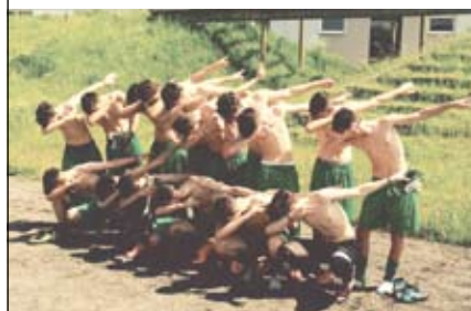
... MA NON SI PUO' GUARDARE CON IL COLBACCO ...

Speriamo si possa ripetere anche nel futuro questo tipo di scambi per valorizzare meglio la nostra coesione nel vivere insieme alcuni giorni di divertimento e di vita sociale e di poter vedere altre visioni del mondo.