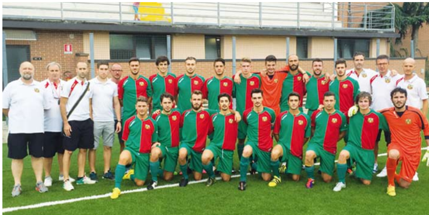
LA "ROSA" DELLA NOSTRA PRIMA SQUADRA IN PROMOZIONE PER LA STAGIONE 2016/17