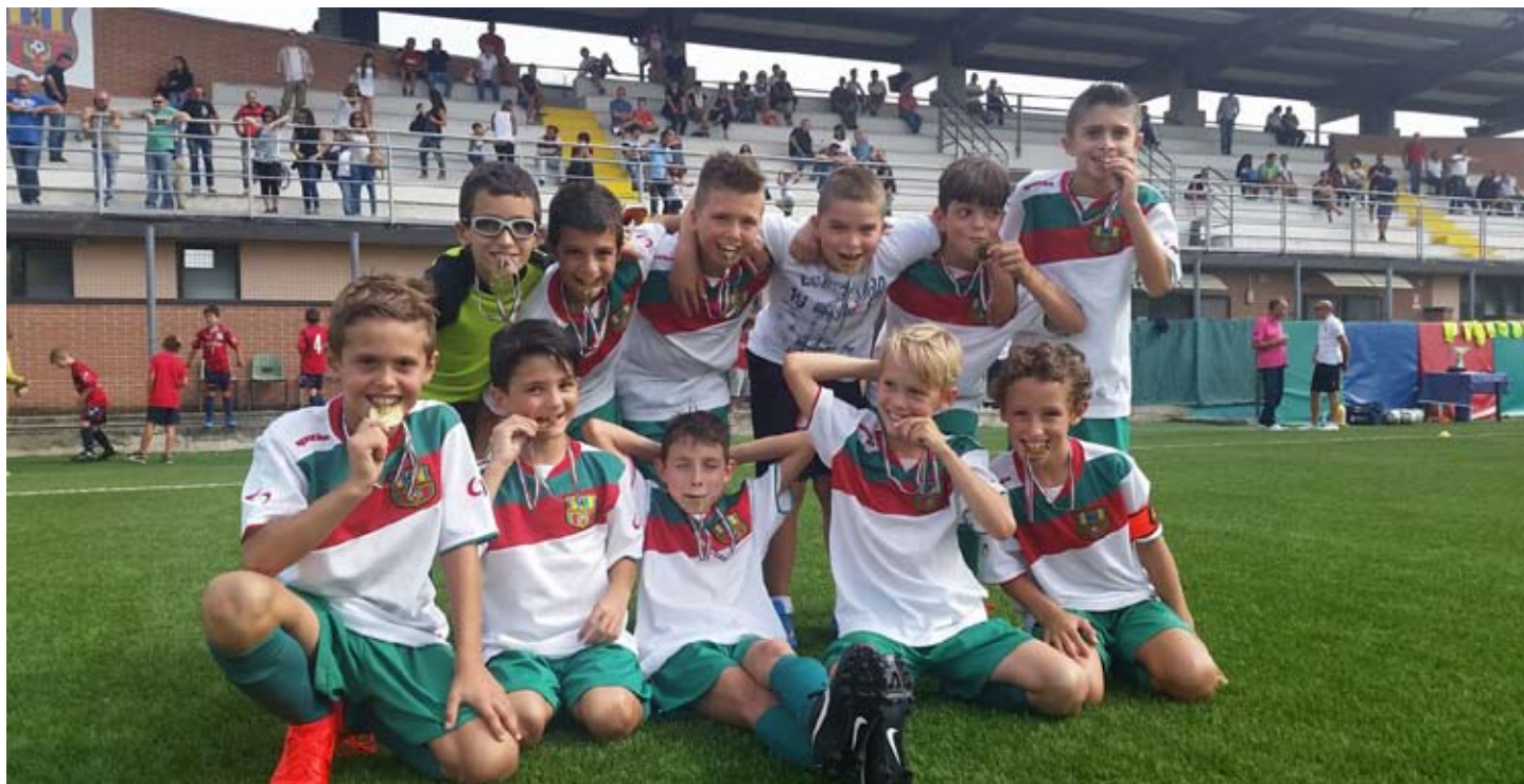
MA CHE BELLO E' ... "MASTICARE" LA MEDAGLIA D'ORO