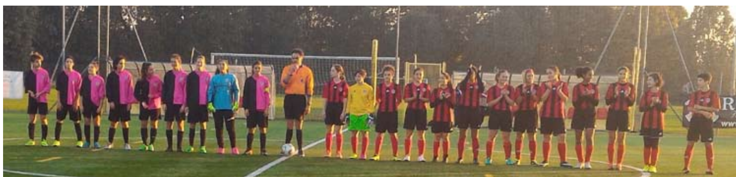
SCHIERATA A SINISTRA LA SQUADRA ALLIEVE FEMMINILE

Attualmente questo gruppo, iscritto al C.S.I (Centro Sportivo Italiano), partecipa al campionato "ALLIEVE" a 7 giocatrici ed anche loro sono nei vertici della categoria.