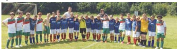
LE SQUADRE DEL 2004 E 2005

Il gemellaggio prosegue con frequenti scambi tra le due realtà con visite in Agrate ed a Ceska in occasione di eventi istituzionali, ma soprattutto durante le feste delle due città e con lo scambio tra le due scuole medie che avviene ogni primavera. Nel giugno scorso, dal 22 al 26, i calciatori della Speranza sono stati invitati a Ceska durante la festa dello Sport per partecipare ad un torneo tra le reciproche squadre.