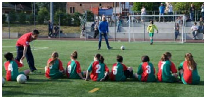
LE ALLIEVE IN ALLENAMENTO

Abbiamo molta fiducia e molto entusiasmo nel nuovo gruppo che si è formato ed il nostro obiettivo per questa stagione è quello di tornare in Serie C che consideriamo un traguardo alla nostra portata.