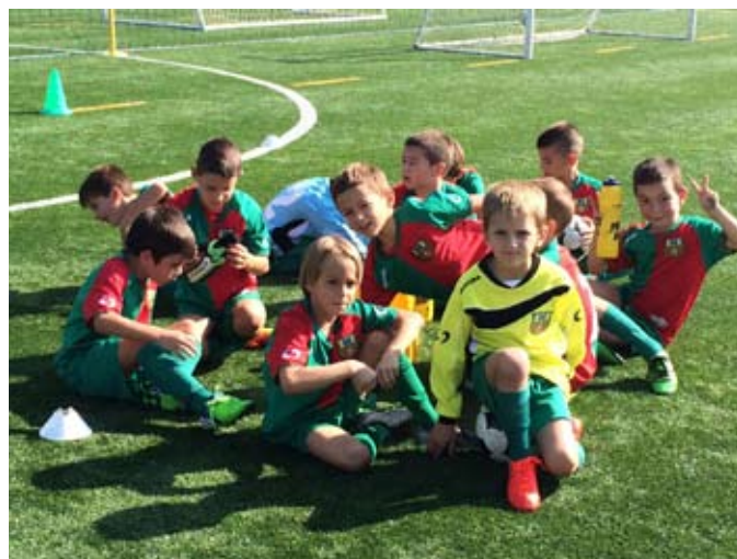
I NOSTRI RAGAZZI DURANTE LE FASI DEL TORNEO

Divertimento assicurato sugli spalti, patatine e salamelle a gogo sotto il nuovo tendone.