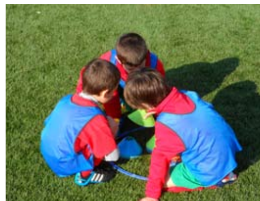
I FUTURI "PICCOLI AMICI" AI NOSTRI OPEN - DAY