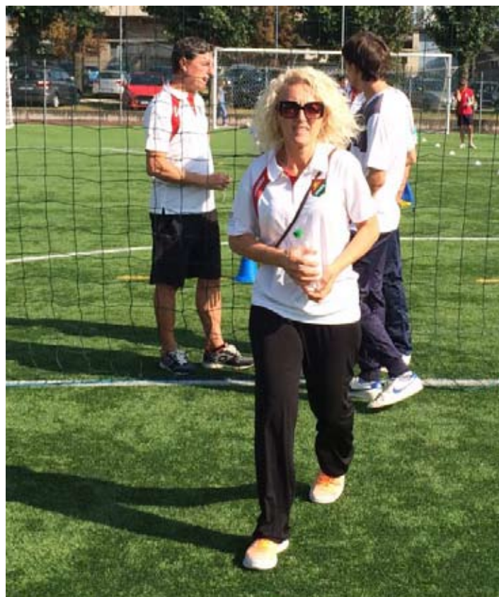
LA MISTER STEFANIA, DONNE AL POTERE!