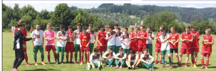
LA SQUADRA DEI 2000