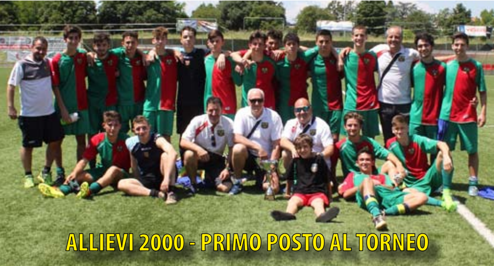
ALLIEVI 2000 - PRIMO POSTO AL TORNEO