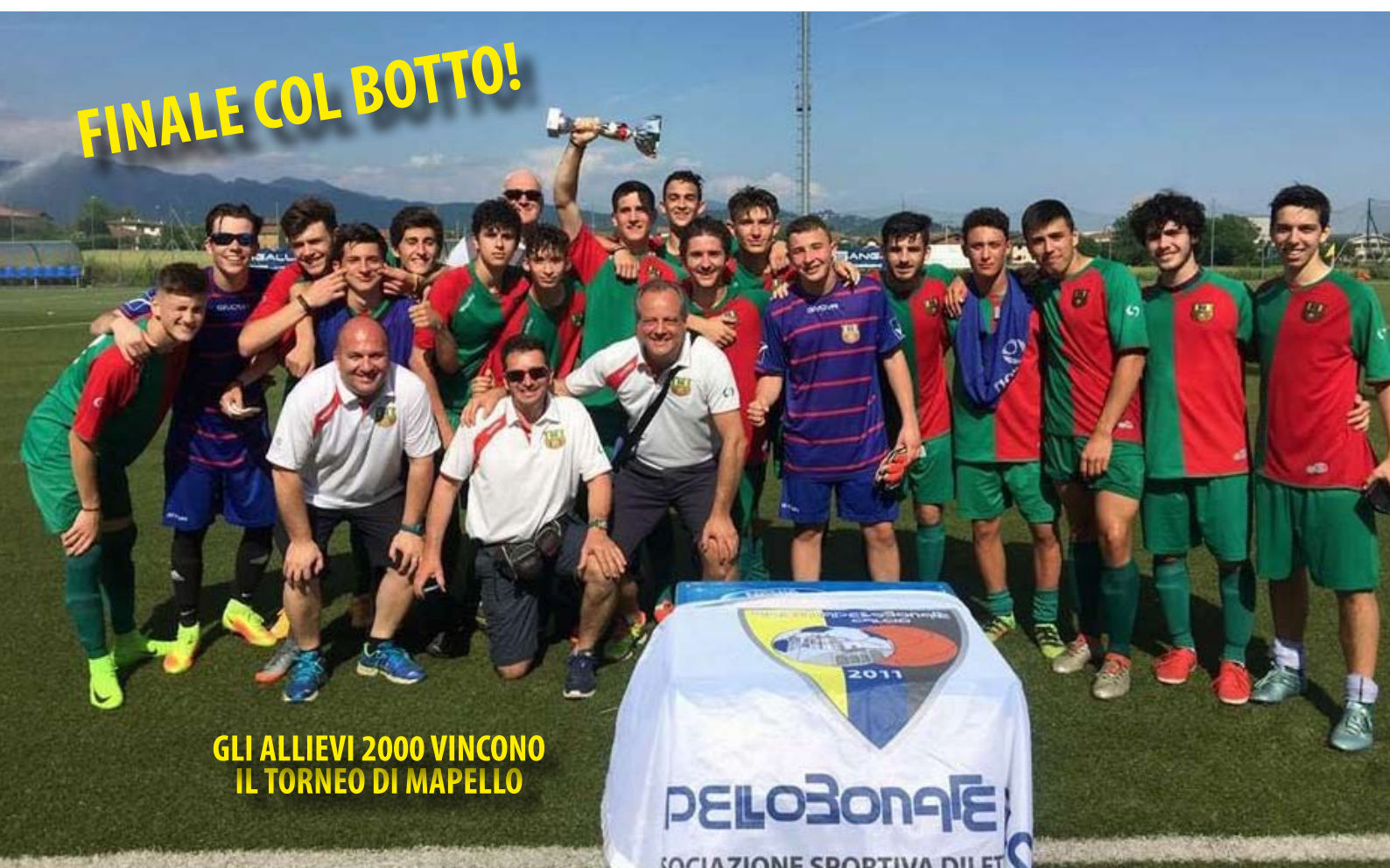
GLI ALLIEVI 2000 VINCONO IL TORNEO DI MAPELLO

sono motivi per cui si debba storcere il naso, perché loro hanno svolto davvero un egregio campionato dimostrato a tutti il loro valore. Stando sempre alle parole del mister, oltre alle individualità molto importanti, la vera forza di questa squadra è il gruppo in sé. Un gruppo composto da tanti agratesi che giocano insieme da molti anni. È questa la vera forza e ciò che rende una squadra memorabile. Inoltre il gruppo possiede, e possedeva già prima del suo arrivo, buone individualità che mister Longobardi ha saputo sviluppare e migliorare. Alcuni di loro hanno già fatto il loro esordio in Juniores, altri ancora in prima squadra. “Con loro ci sono tutti i presupposti per fare bene, sono dei ragazzi fantastici che hanno una gran voglia di vincere e giocare”. Con queste toccanti parole Giovanni Longobardi saluta la sua squadra ed è convinto che con i “suoi” ragazzi l'anno prossimo la juniores possa solo fare bene. Mister questo è un augurio che noi tutti speriamo!!