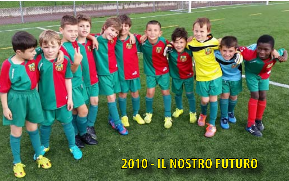
2010 - IL NOSTRO FUTURO

La quarta edizione del nostro torneo, nel corso di 21 giornate , ha visto schierate squadre provenienti da oltre 20 paesi della provincia di Monza e Milano. Con 13 categorie rappresentate dai piccoli amici fino alla Juniores, per un totale di oltre 90 squadre , più di mille giovani calciatori scesi in campo e migliaia di spettatori sugli spalti, rappresenta oggi uno dei tornei di calcio giovanile più seguiti della Lombardia. Un mese impegnativo, grandi sforzi da parte dei nostri volontari (genitori, dirigenti, allenatori e simpatizzanti) ed enorme soddisfazione per i risultati ottenuti insieme. Ancora una volta grazie a tutti! Al prossimo anno!