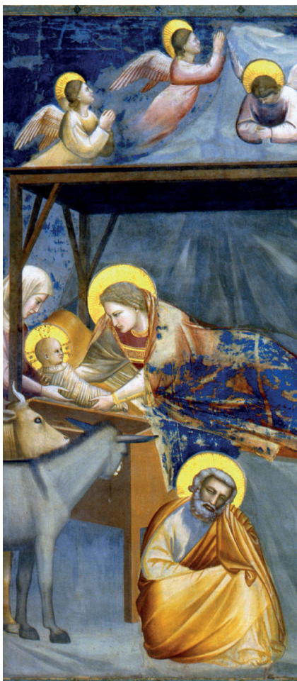
Giotto, Natività Padova, Cappella degli Scrovegni